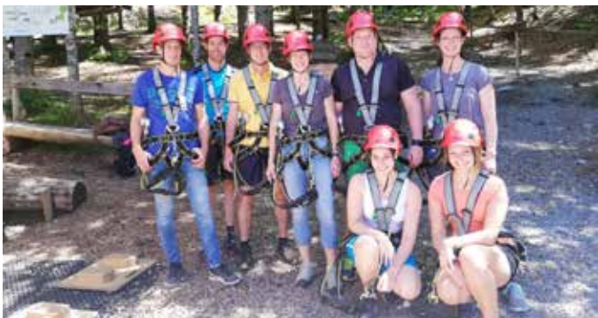
Unser Trainerteam im Waldseilgarten

Um die vergangene Saison gebührend zu schätzen, wurden so ziemlich alle Beteiligten mit einem Ausflug belohnt. Nachdem die Schnupperkaderläufer einen Ausflug ins Val Blue unternahmen und die älteren Kaderläufer den Skyline Park besuchten, wurde das gesamte Trainerteam von den Eltern mit einem ganz besonderen Ausflug in das Montafon, auf den Golm, zum Waldseilgarten mit Flying Fox und Rollercoaster eingeladen. Es war ein Tag mit wirklich großartigen Höhepunkten (vor allem beim Klettern in schwindelerregenden Höhen!) – die Trainer genossen den Tag und sind nun wieder top motiviert und in Form für die kommende Saison. Ein Danke an alle Eltern für dieses tolle Geschenk!