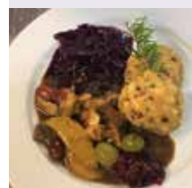
Rehgeschnetzeltes mit Steinpilz-Orangen-Sauce Rotkraut und Knödel