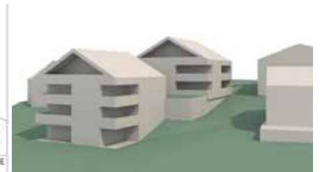
Lageplan und Ansichtsskizze der beiden Wohngebäude. (Quelle: Alpenländische Wohnbaugesellschaft / Änderungen vorbehalten)