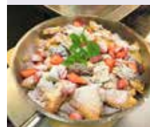
Kaiserschmarren mit Apfelmus und Zwetschkenröster