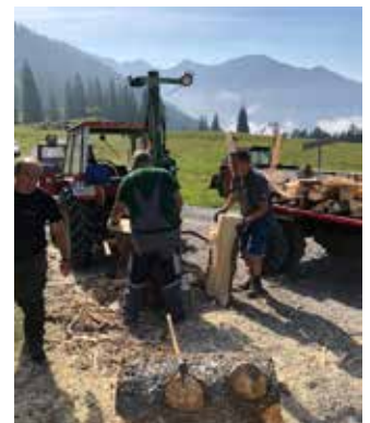
Starke Helfer bei der Holzverarbeitung

Ebenso halfen wir auch diesen Sommer wieder beim Schweinerennen auf dem Gutshof Mätzler in Brederis. Durch die wirklich sensationelle Unterstützung von vielen Kadereltern und Vereinsmitgliedern konnten wir die gesamte Wirtschaft mit zwei Schichten abdecken und somit unsere Vereinskassa wieder etwas aufbessern.