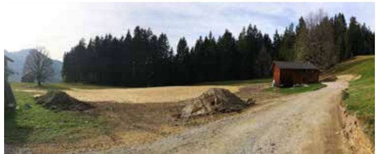
Deponie III - Birihof: Renaturierung