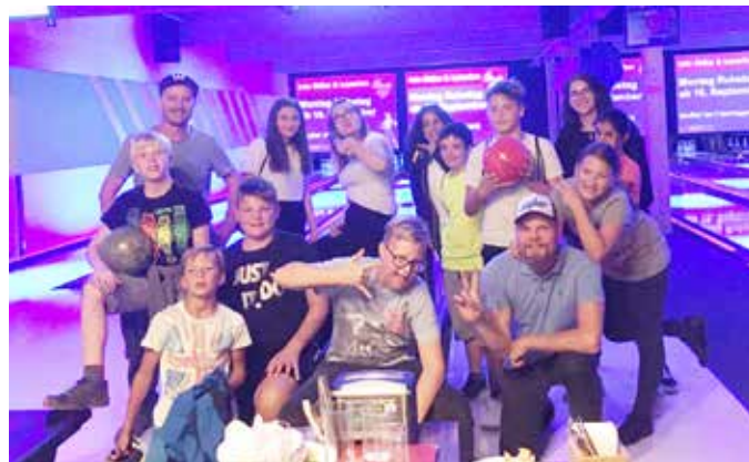
Spaß und Begeisterung beim Bowling

Bei der Rückfahrt mit dem Zug waren alle Jugendlichen vom Abend sichtlich begeistert.