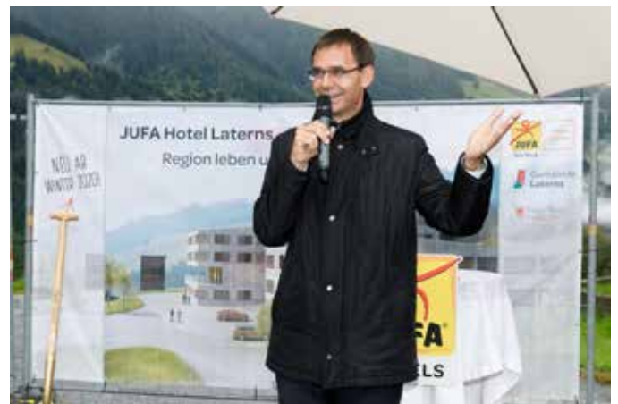
Landeshauptmann Markus Wallner bei der offiziellen Spatenstichfeier

Von einer „bemerkenswerten Investition in die dörfliche Lebensqualität und den Lebensraum“ sprach Landeshauptmann Wallner in seinen Grußworten. Laterns würde sich mit dieser beachtlichen Weichenstellung erfolgreich für die Zukunft wappnen, handle es sich doch um ein Vorhaben, das der gesamten Region einen Nutzen bringt.