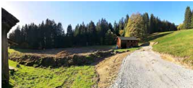
Deponie III - Birihof: Beginn der Deponiearbeiten