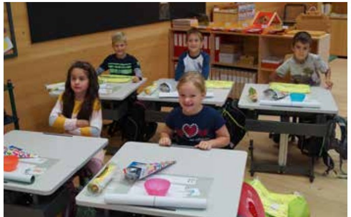
Die neuen Erstklässler