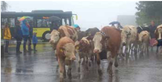
Zu Fuß ins Tal

Am 7. September 2019 startete die Alpe Gapfohl ihren Weg ins Tal. Im Regen- und Nebelschein trabte das Vieh mit Glockenklang und Blumenschmuck, unter Begleitung des Hirtenpaares Daniela und Lukas, auf den Parkplatz der Schilifte Laterns. Dort wurden die Tiere von Ihren Landwirten schon erwartet und führten es heim.