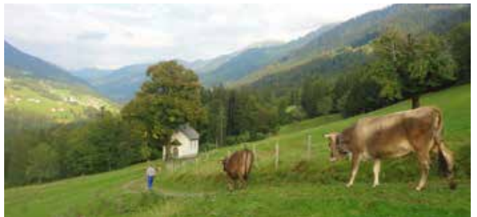
Der Alpsommer verabschiedet sich

Die Alpe Wies begab sich am 20. September 2019 auf den Heimweg. Die Tiere wurden - bis auf wenige Ausnahmen - heimgefahren.