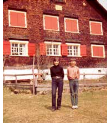
Die alte Hütte mit dem jugendlichen Jubilar und seiner Schwester