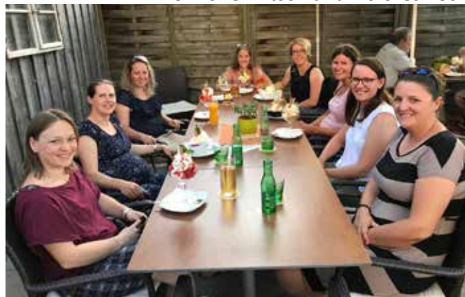
Abschluss mit Eis essen