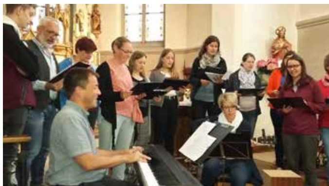
Singen bei der Langen Nacht der Kirchen