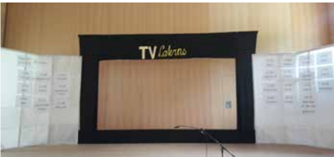
TV Laterns: Unser eigenes Fernsehprogramm

Mit dabei waren die Spielgruppe, der Kindergarten, Nicole Rigo mit der Musikschule und wir. Im Anschluss durften sich alle Fernsehstars bei einem köstlichen Buffet der Eltern stärken.