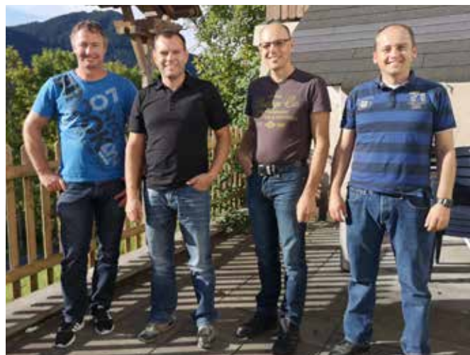
Sprenkelwahlkommission Bonacker, Landtagswahl 19