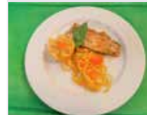
Bachforellenfilet mit Safranspaghetti