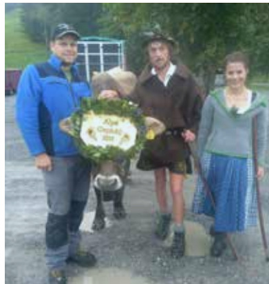
Freudiger Empfang der Alptiere