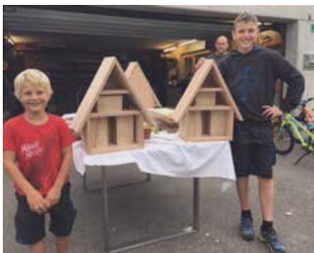
Die fertigen Häuschen

Voller Elan und Tatendrang fertigten 5 Kinder ihr eigenes Wildbienenhaus. Da wurde gebohrt, gesägt, geschmirgelt und geschraubt. Die fertigen Häuschen wurden auch bereits eingerichtet, um den ersten Wildbienen im Frühling ein Zuhause bieten zu können.