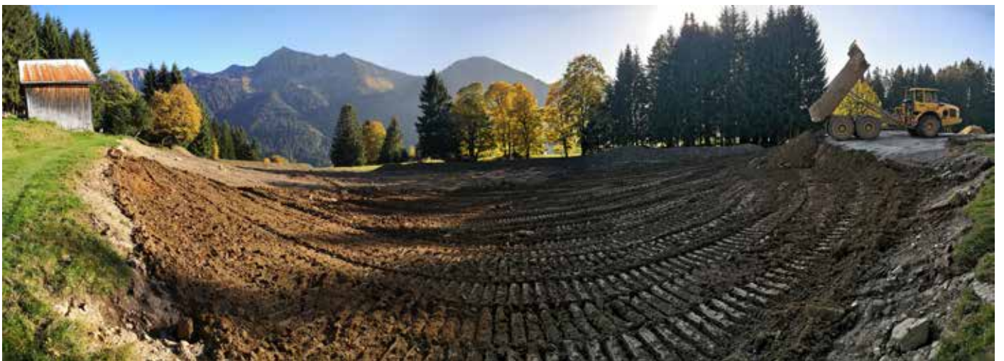
Aufschüttungen im Bereich Deponie II - Skipiste