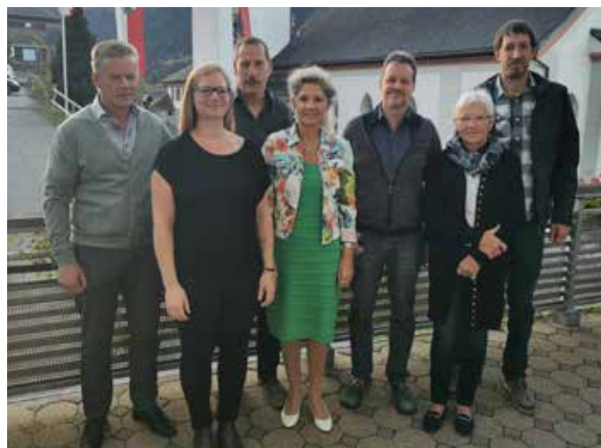
Sprenkelwahlkommission Laterns, Landtagswahl 19