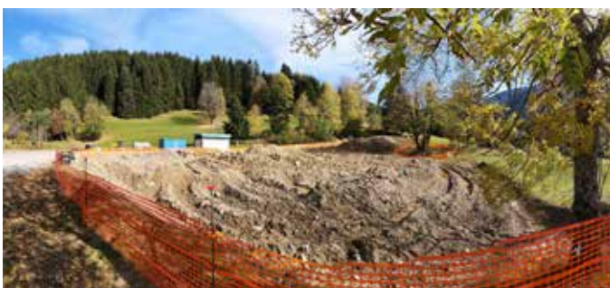
Aufschüttungen im Bereich Deponie I - Parkplatz