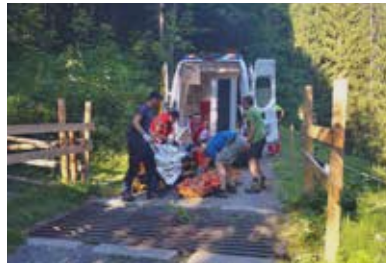
Unfall Fahrradfahrer Absturz