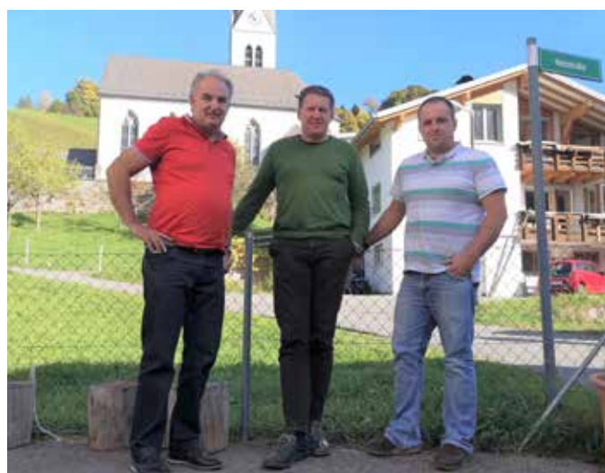
Sprenkelwahlkommission Innerlaterns, Landtagswahl 19