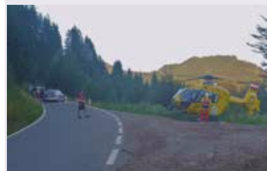
Unfall Quad / Motorrad

Zur Erinnerung: Wenn in einer Notsituation Hilfe über die Notrufnummer 144 oder 122 angefordert wird, werden wir First Responder IMMER automatisch mitalarmiert. Bitte nicht wertvolle Zeit verstreichen lassen, um zuerst jemanden von uns zu erreichen. Wir können leider auch nicht immer garantieren, speziell untertags, daß ein Gruppenmitglied in der Talschaft ist und den Einsatz übernehmen kann. In der restlichen Zeit stellen wir uns gerne in unserer Freizeit ehrenamtlich in den Dienst.