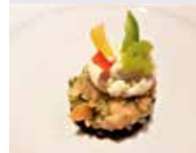
Marinierter Blattsalat mit Lachs Tartar