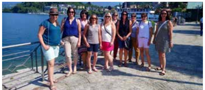
Kademama's am Lago Maggiore.

Auch die Mama's konnten sich dieses Jahr an einem sehr sonnigen Wochenende im Juli am Lago Maggiore von der anstrengenden Wintersaison erholen und in gelassener und gemütlicher Atmosphäre, die besten Schifahrer-Tipps untereinander austauschen.