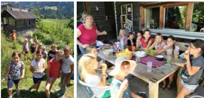
Beim Sammeln der Kräuter - Gut schmeckt's